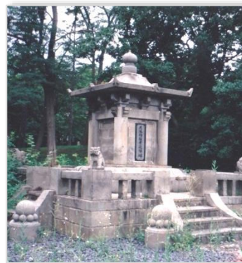
尼港殉難者追悼碑（小樽市）