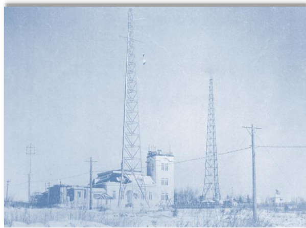
中央气象台臨時豊原地磁気観測所 と 樺太庁観測所 (写真は『樺太庁施政三十年史』1936より)