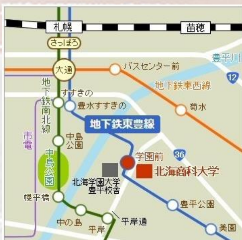
地下鉄東豊線「学園前」駅出入口4番直結